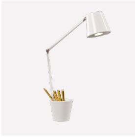
TABLE LAMP SOBREMESA